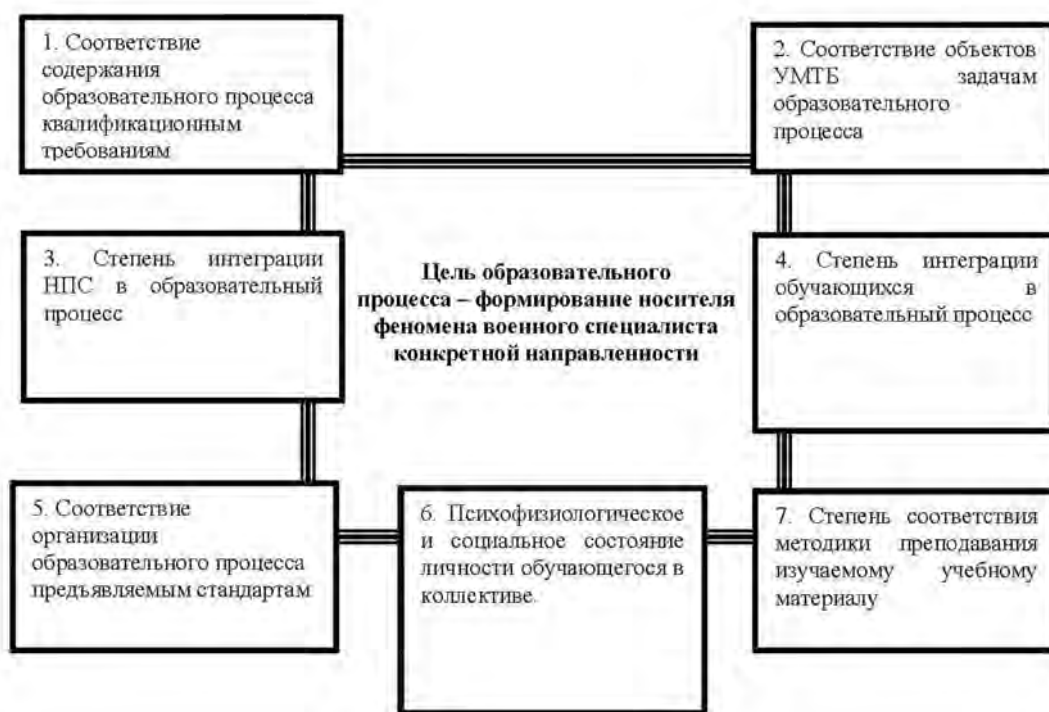
Рис. 2. Основные факторы, влияющие на функционирование образовательного процесса

Таким образом, образовательный процесс в военном вузе представляет собой сложную замкнутую педагогическую систему, функционирующую под воздействием значительного числа факторов с определенной конкретной целью. В общем виде основные факторы, влияющие на функционирование образовательного процесса, можно представить в виде схемы (рис. 2).