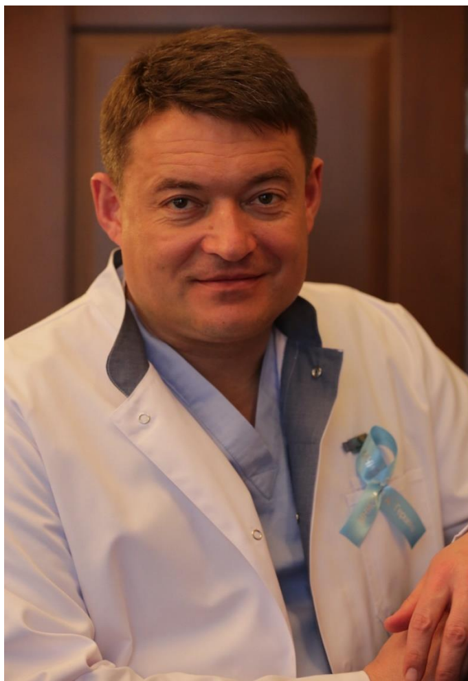
КАПРИН АНДРЕЙ ДМИТРИЕВИЧ Дорогие коллеги!

Приглашаю Вас принять участие во Втором международном Форуме онкологии и радиологии.