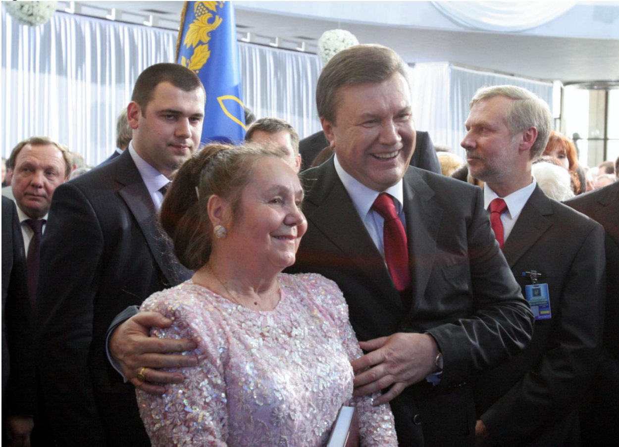
Приложение №3 Наши блок «Леониди Кучма».